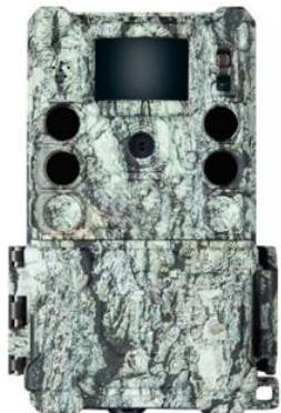
Bushnell 119949 C

10 tarjeta de memoria SDXC GIGASTONE de 64GB